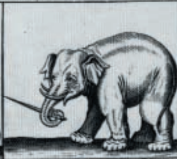
Hij Schermt met Deegh