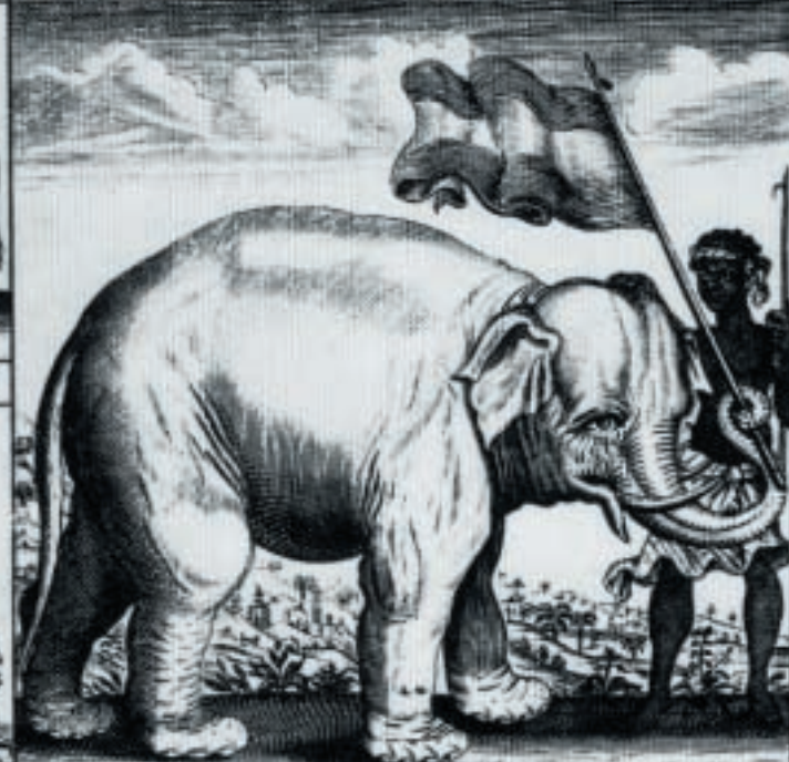
Hij Svaelt de Vlagh. Schermt zynen