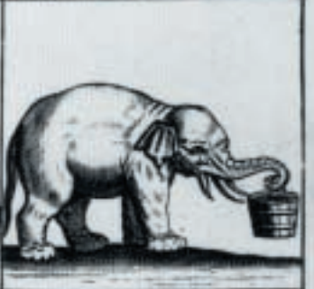
Hij draeght Water