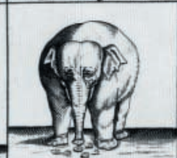
Hij raspt het Gede op