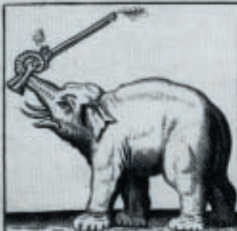
Hij geeft Vuur-