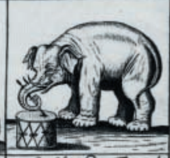
Hij Slaet de Fromel