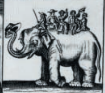
Hij doet Reuerentie