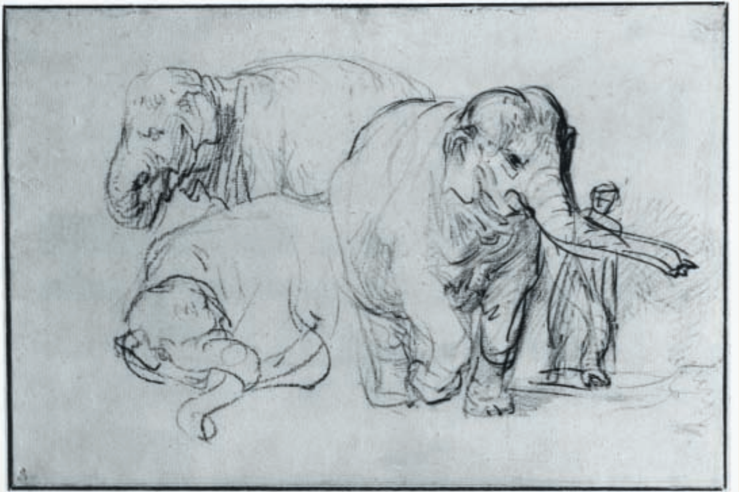
Enkele jaren later tekent Rembrandt Hansken opnieuw. Ditmaal tekent hij de olifant, die duidelijk ouder oogt, niet éénmaal, maar driemaal. Op deze manier legt hij verschillende houdingen van het dier vast.