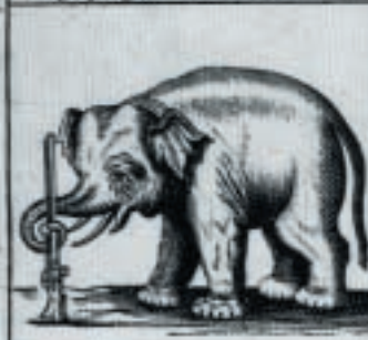
Hij Staat Senternel