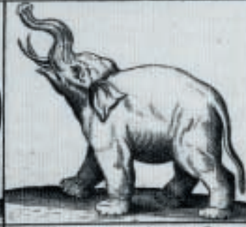
Hij toont zyn Tande,