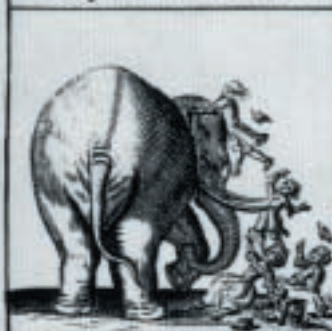
Hij toont hem van agtere