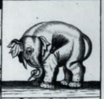
Hij Veeght hem